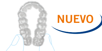
V-Print splint comfort 4 Férulas terapéuticas, piezas auxiliares y funcionales para el diagnóstico, férulas para el blanqueamiento (blanqueamiento domiciliario)