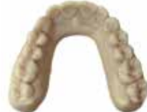
V-Print model Toda la gama de modelos de la técnica dental