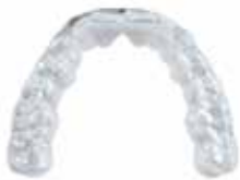
V-Print splint Férulas terapéuticas, piezas auxiliares y funcionales para el diagnóstico, férulas para el blanqueamiento (blanqueamiento domiciliario)