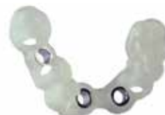
V-Print SG Plantillas de perforación dentales