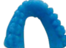
V-Print model fast Modelos de rápida impresión, especialmente para la técnica de termovacío dental