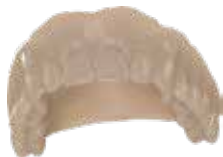
V-Print Try-In Objetos de prueba para la protodoncia