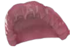
V-Print dentbase Bases de dentaduras para la prótesis removable