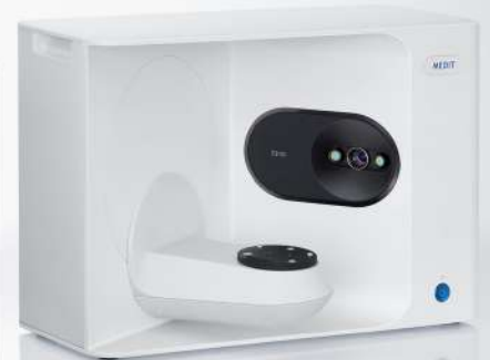
MEDIT T510 MIT001155