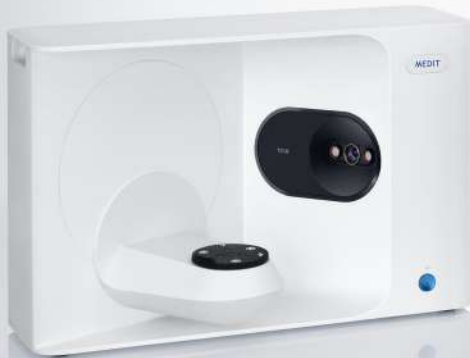
MEDIT T310 MIT001150

Hay un escáner extraoral Medit Serie-T diseñado especialmente para tí.