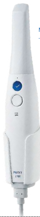
Medit i700 MIT001240

Ahorre tiempo Tan sencillo como enchufarlo al ordenador y empezar a trabajar