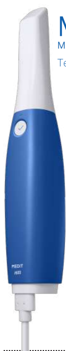
Medit i600 MIT001252

Los escáneres intraorales MEDIT hacen del escaneo dental un juego de niños.