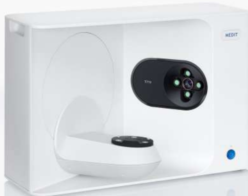
MEDIT T710 MIT001160