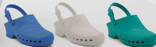
Azul / Blue 35-47 Blanco / White 35-47 Verde / Green 35-47

La microfibra, el tejido que revoluciona el concepto del calzado laboral. Microfiber, the fabric that changes the concept of professional footwear.