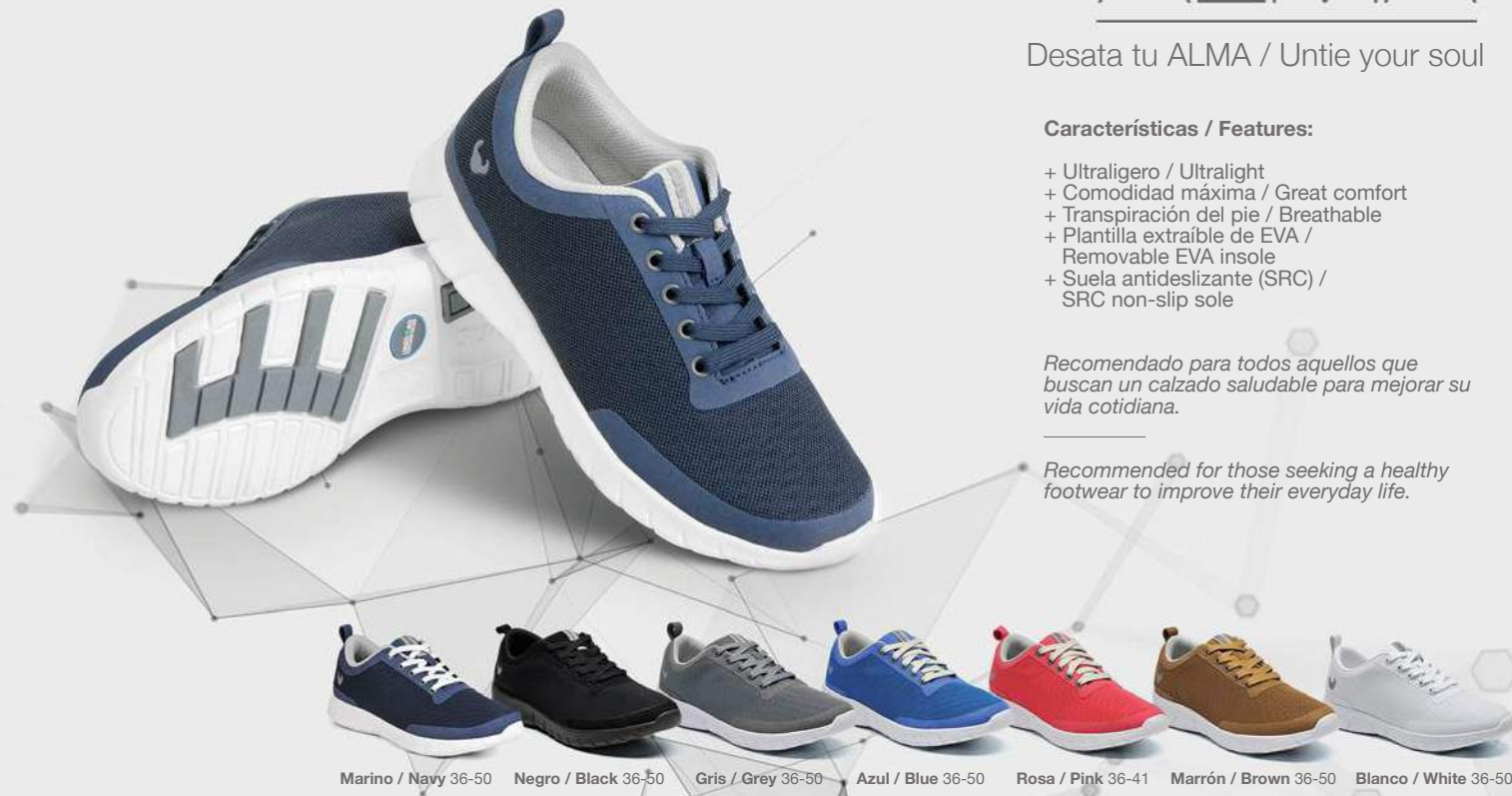
Marino / Navy 36-50 Negro / Black 36-50 Gris / Grey 36-50 Azul / Blue 36-50 Rosa / Pink 36-41 Marrón / Brown 36-50 Blanco / White 36-50

Recommended for those seeking a healthy footwear to improve their everyday life.