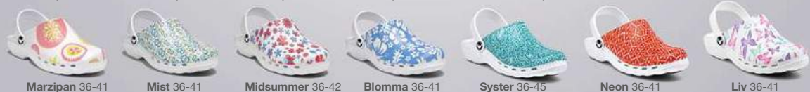
Marzipan 36-41 Mist 36-41 Midsummer 36-42 Blomma 36-41 Syster 36-45 Neon 36-41 Liv 36-41