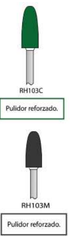
RH103C Pulidor reforzado.