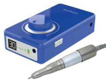
Ref. PUL4M3205 Azul