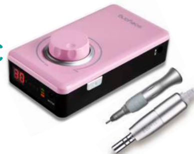
Ref. PUL4M3160 Rosa

¡De regalo! Contraángulo (ROT000330) Pedal (PUL910065)