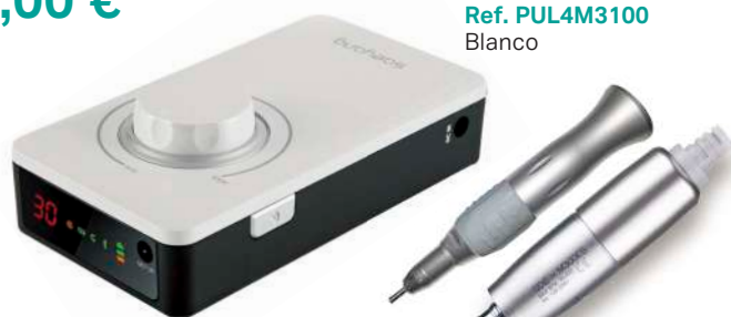
Ref. PUL4M3100 Blanco