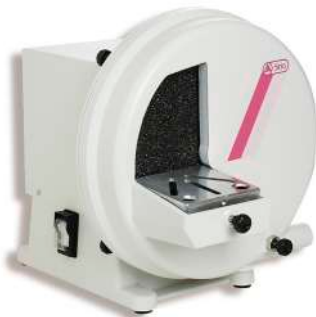
Separadora modelos SIRIO con aspiracion Mod. SR2