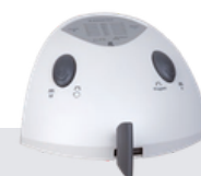
Control mediante pedal

Unidad de control universal KaVo K-Control TLC con opciones que se adaptan a requisitos individuales o al espacio disponible (control de mesa, rodilla o pie), piezas de mano fáciles de sustituir gracias al reconocimiento automático de la pieza de mano, la versión de rodilla se puede acoplar a un gancho de rodilla KaVo K-Control existente, interruptor de seguridad para permitir velocidades de giro superiores a 30.000 rpm, en sentido horario y antihorario, en función de la pieza de mano, de hasta 50.000 rpm, 4 programas memorizables: ahorro en 4 segundos para una función de control de velocidad de 4 segundos, pantalla de 4 colores para una fácil diferenciación, acceso rápido a las velocidades y los pares preestablecidos con solo pulsar el control de velocidad