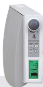
Control de rodilla