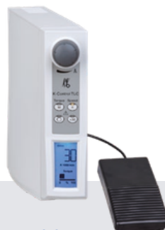
Control de mesa